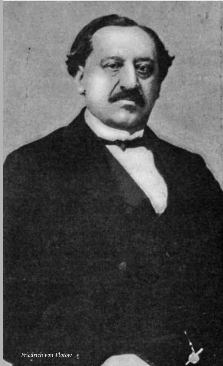
Friedrich von Flotow

Wilt u dit blad niet verknippen, dan kunt u het aanmeldingsformulier kopiëren.