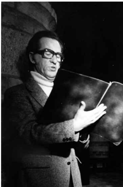
In zijn glansrol als Osmin in Die Entführung aus dem Serail, 1960

Aan zingen bij de opera kwam hij niet meer toe. In 1974 werkte hij nog mee aan De Paradijsappel , een 'kerkmusical' naar bijbelse motieven in de Jacobuskerk in Enschede. Hij was in zijn element in de rol van verteller en liet zijn plechtig gedragen teksten 'resoneren in de ruimte'. Soms verleende hij nog solistische medewerking aan een plaatselijk koor waar zijn diepe bas weer even bezit nam van de concertzaal en waar hem dan een ovationeel applaus ten deel viel.